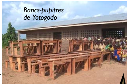
Bancs-pupitres de Yotogodo

Bonjour, Le mois de juin a été riche en événements, vous lirez ici tout ce qui s'est passé pour l'Association. Merci et bravo à ceux qui l'on cité dans ce journal. Je vous souhaite à tous un excellent été, à très bientôt, Ulysse B.