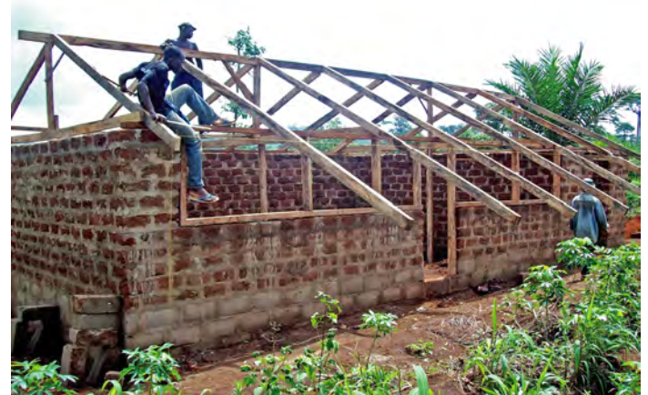
Logement de l'éleveur

Le poulailler emploiera un éleveur, un gardien aidé par un chien pour la sécurité des poules, un vétérinaire qui interviendra en qualité de prestataire de service. Un comité de contrôle supervisera le projet et sera composé d'un membre de l'équipe de GADIS, de deux membres du Comité de parents d'élèves et de deux volontaires d'aides locales.