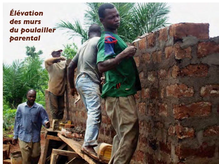
Élévation des murs du poulailler parental