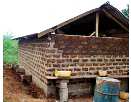
"Poulailler des jeunes"